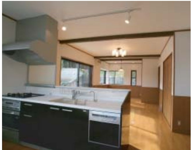
客間、リビングとキッチンを一体化。温水床暖房で快適に。

地球環境の面からも経済性の面からも 今、リフォームが大きな注目を集めています。 一級建築士事務所エスケイ企画は住宅や店舗の豊富な実績を基に リフォームでも暮らしが「もっと素敵に」「もっと楽しく」「もっと快適に」なるように アイデアをカタチに変えていきます。