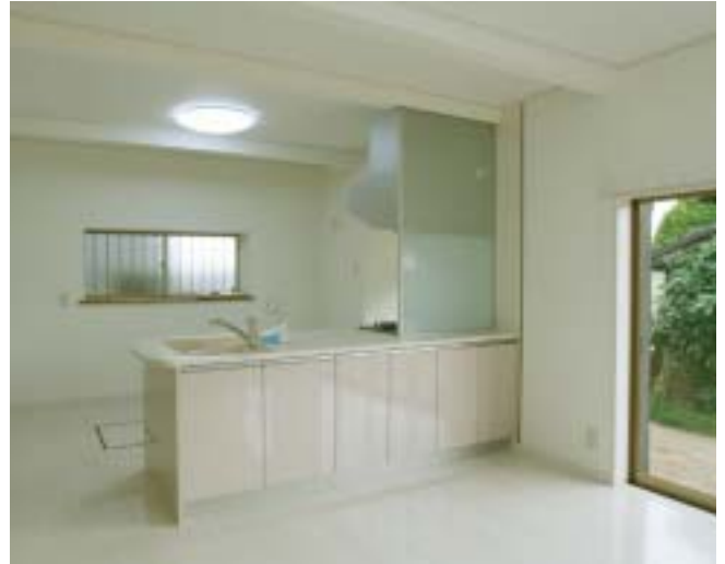
白で統一された一体型キッチン。レイアウトも大きく変更しました