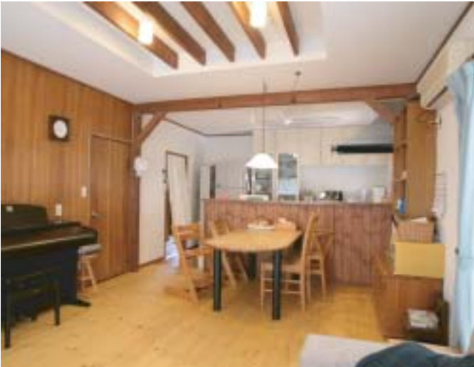
カントリー調にデザイン。天井を高く見せるため梁を現しました。

数多くの店舗設計も手がけるエスケイ企画の 「デザイナーズ・リフォーム」で デザイン性も暮らし心地もUP!!!